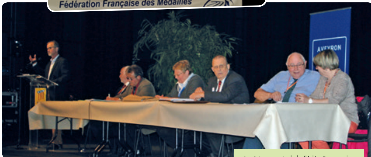
Les intervenants de la Fédération en place.