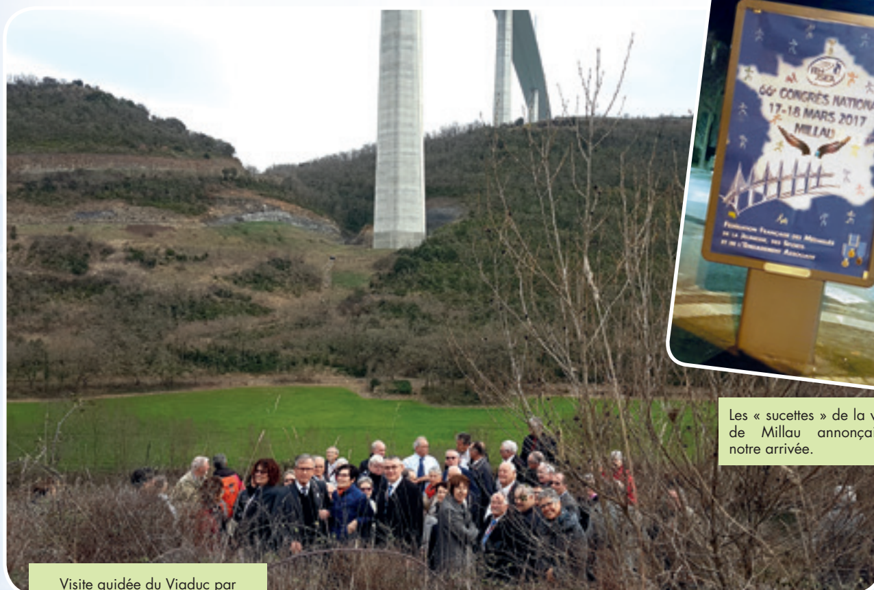
Visite guidée du Viaduc par M. Le Ministre Jacques Godfrain.