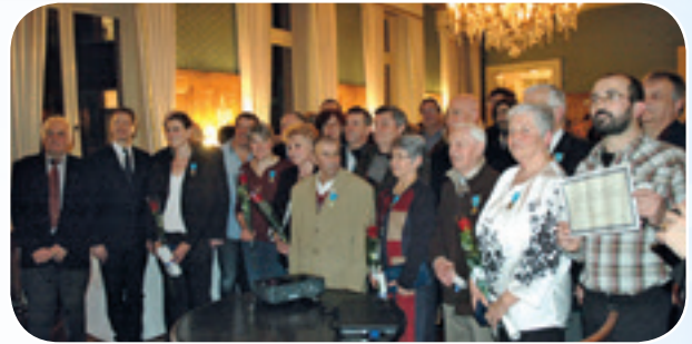
Une bien belle assemblée.