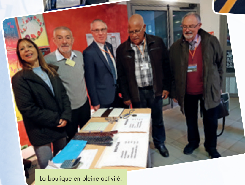
La boutique en pleine activité.