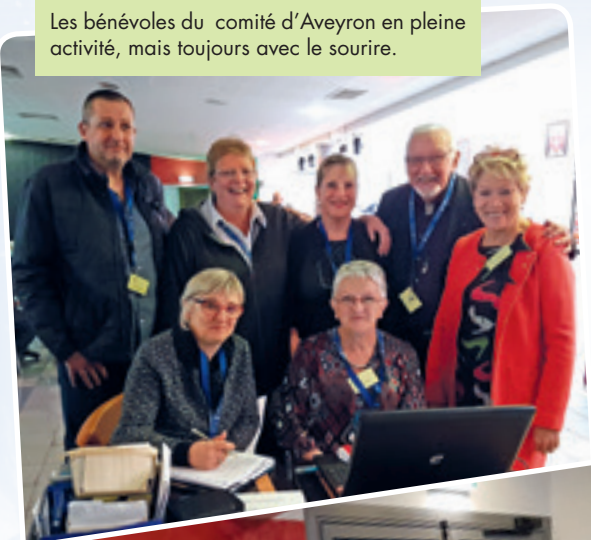
Les bénévoles du comité d'Aveyron en pleine activité, mais toujours avec le sourire.