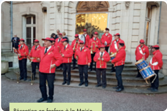
Réception en fanfare à la Mairie.