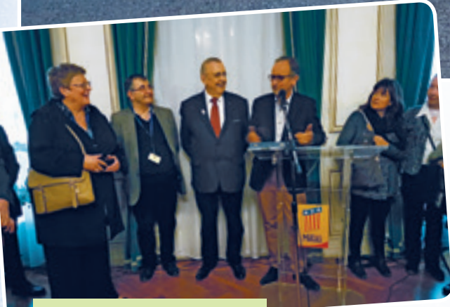
Réception à la mairie de Millau.