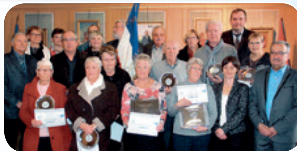
7 femmes et 5 hommes ont été mis à l'honneur et ont reçu un trophée de la Fédération récompensant leur engagement bénévole.