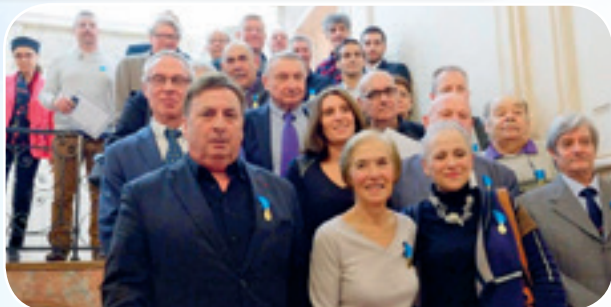
Une bien belle représentation