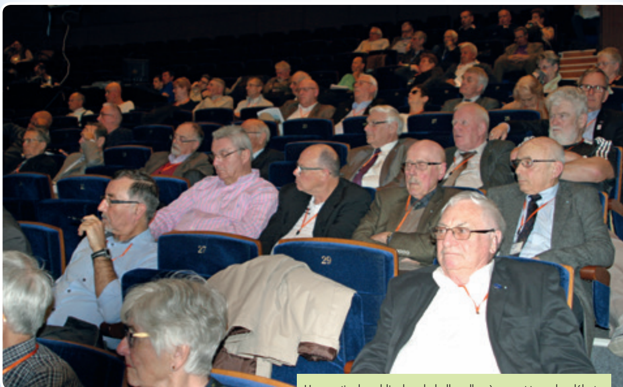
Une partie du public dans la belle salle où se sont tenus les débats.