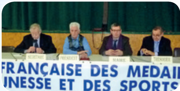
Le bureau du comité qui a animé l'AG

39 bénévoles particulièrement impliqués dans le monde sportif et dans l'Engagement Associatif furent décorés de la médaille ministérielle : 3 médailles échelon Or, 8 médailles échelon Argent, 28 médailles échelon Bronze furent attribuées.