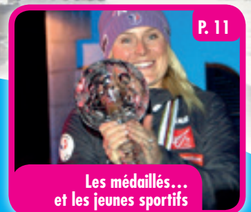
Les médaillés... et les jeunes sportifs

Sous le haut patronage de M. le Président de la République et du Ministre en charge de la Jeunesse et des Sports. Reconnue d'utilité publique le 9 juillet 1958. N° inscription préfecture de police 16270. Agrément jeunesse et éducation populaire en date du 23 juin 2006. N° agrément Sport n° 75.SVF.04.19