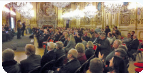
Beaucoup de monde pour cet instant merveilleux pour les bénéficiaires de cette distinction.