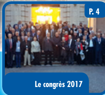
Le congrès 2017