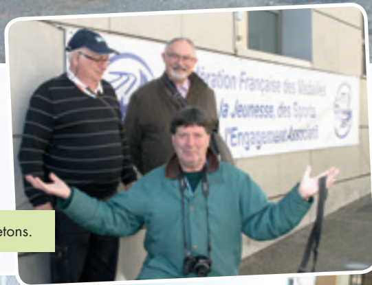
Clin d'œil des bretons.