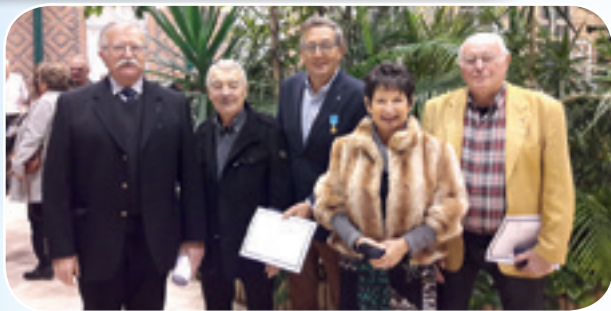
Une partie des récipiendaires à l'honneur.