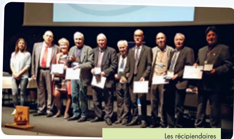
Les récipiendaires des Médailles d'Or de la Fédération.