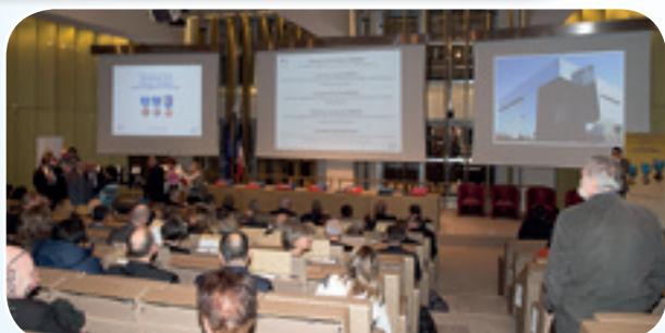
La cérémonie s'est déroulée dans le Grand Auditorium de la préfecture de Région IDF - préfecture de Paris.