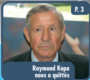
Raymond Kopa nous a quittés

Médailleurs de la Jeunesse, des Sports et de l'Engagement Associatif