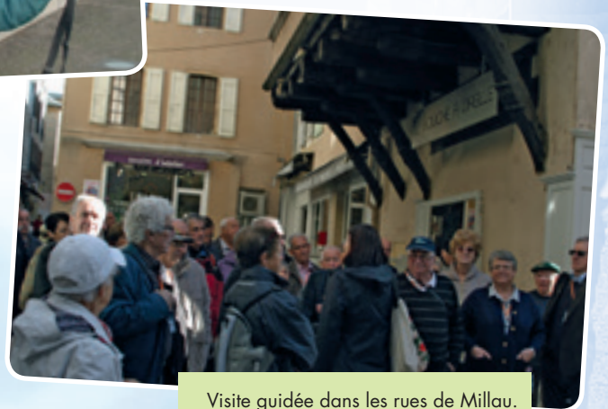
Visite guidée dans les rues de Millau.