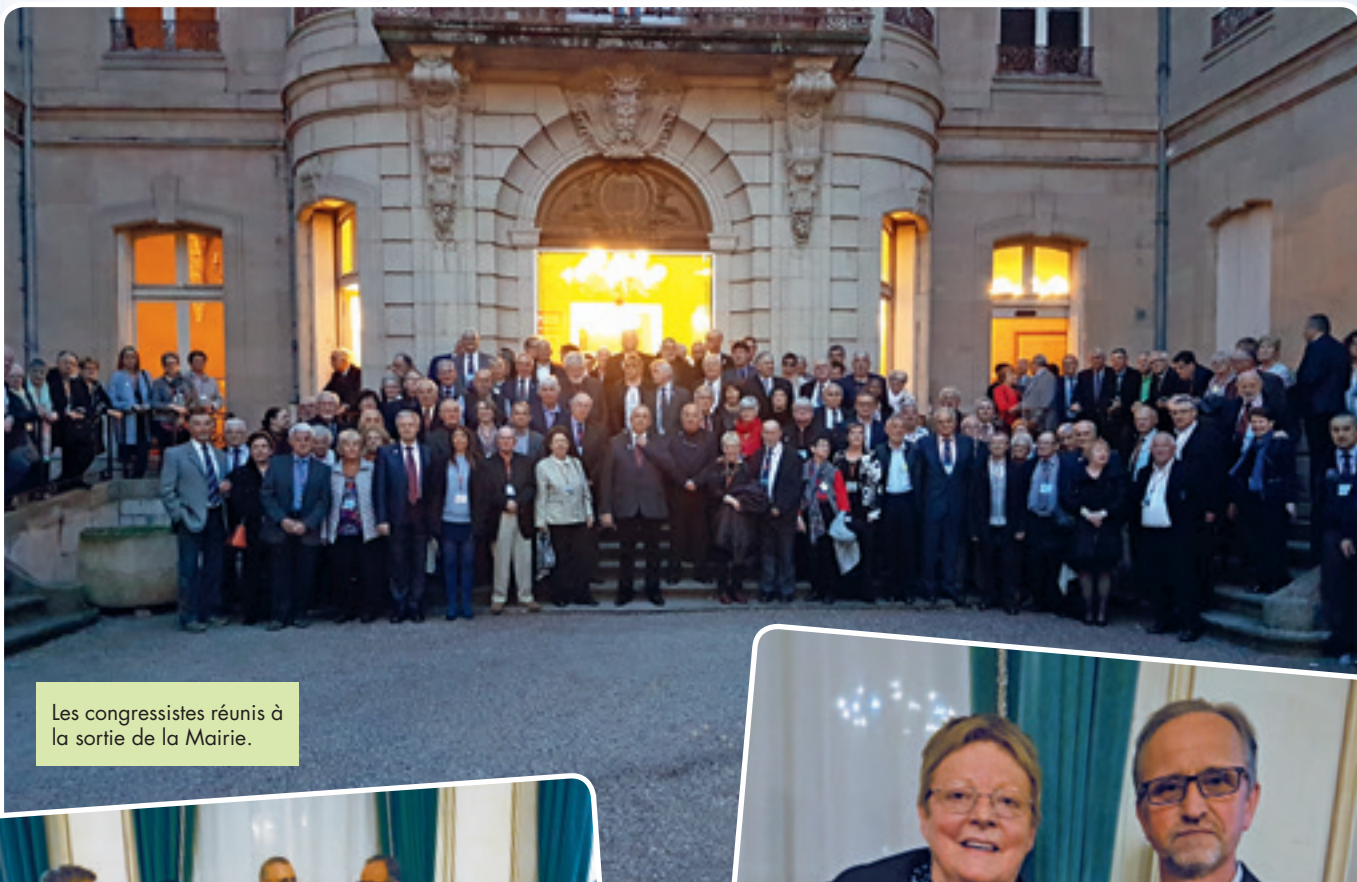
Les congressistes réunis à la sortie de la Mairie.