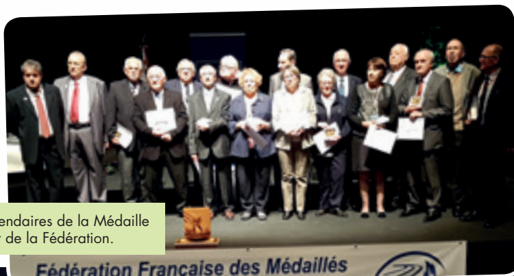
Les récipiendaires de la Médaille Grand-Or de la Fédération.