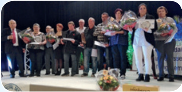
Dix bénévoles (cinq dames, cinq hommes) du département venus de Boyer, Tournus, Chagny, Chalons-sur-Saône, Châtenoy-Le-Royal, Cheilly-les-Maranges, Digoïn, Le Creusot ont été honorés.