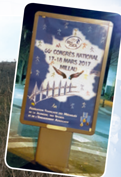
Les « sucettes » de la ville de Millau annonçaient notre arrivée.

Ce sont plus de 200 congressistes, accompagnés de leurs conjoints pour la plupart, qui se sont déplacés dans l'Aveyron. Le Congrès a fait l'objet de discussions sur la réforme des statuts et du règlement Intérieur qui impactent notre vie fédérale. Les statuts ont été approuvés, mais pas le règlement intérieur, lequel fera l'objet d'une étude plus approfondie.