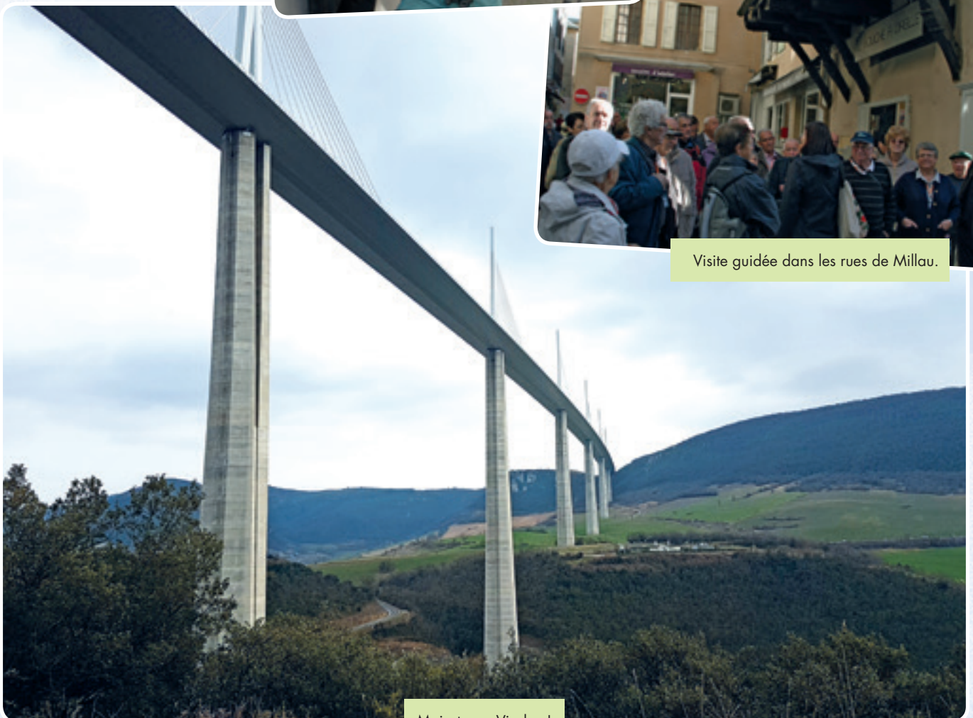
Majestueux Viaduc !