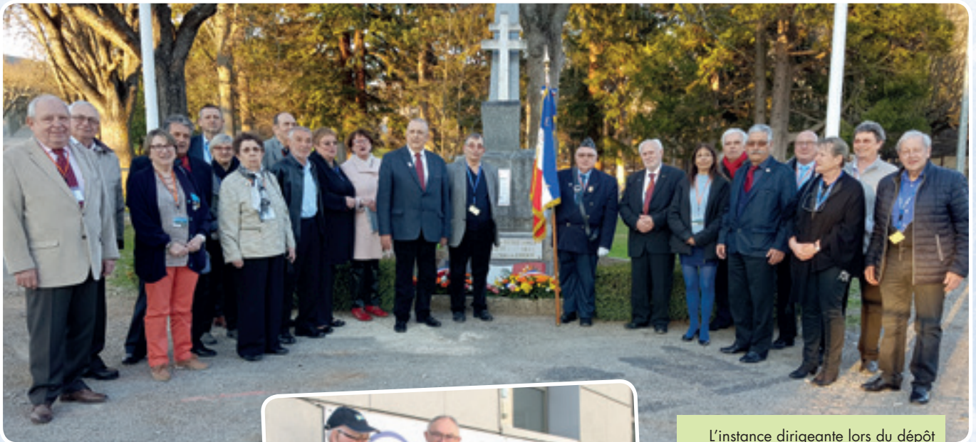
L'instance dirigeante lors du dépôt d'une gerbe aux disparus de Millau.